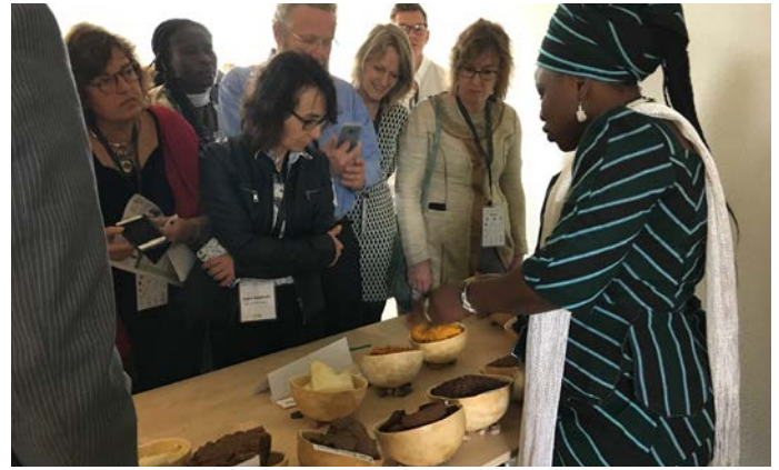
Les groupes de femmes parrainés par l'AGK exposent les étapes de traitement.

Les présentations sont disponibles pour tous les membres de l'AGK. Veuillez envoyer un courriel à Nestor Dèhouindji à ndehouindji@globalshea.com pour les recevoir.