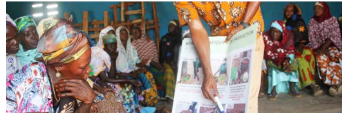
Les partenaires de l'AGK en formation sur la qualité

En plus, 276 femmes du Burkina Faso ont été formées au développement coopératif et à la gestion des entrepôts.