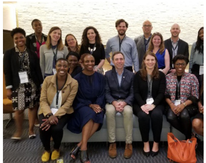
Photo de famille des participants